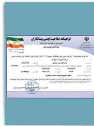
گواهینامه تایید صلاحیت ایمنی