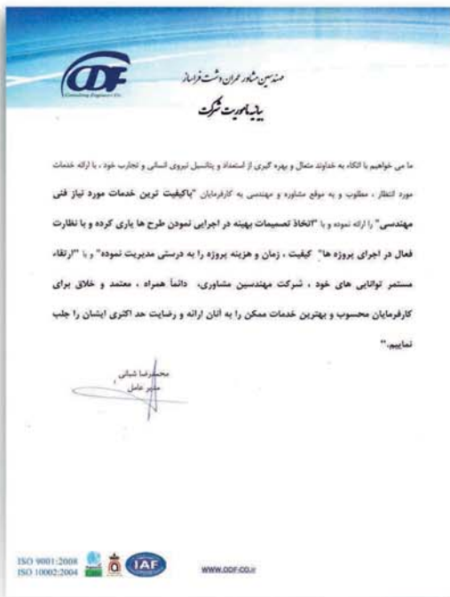
بیانیه ماموریت شرکت