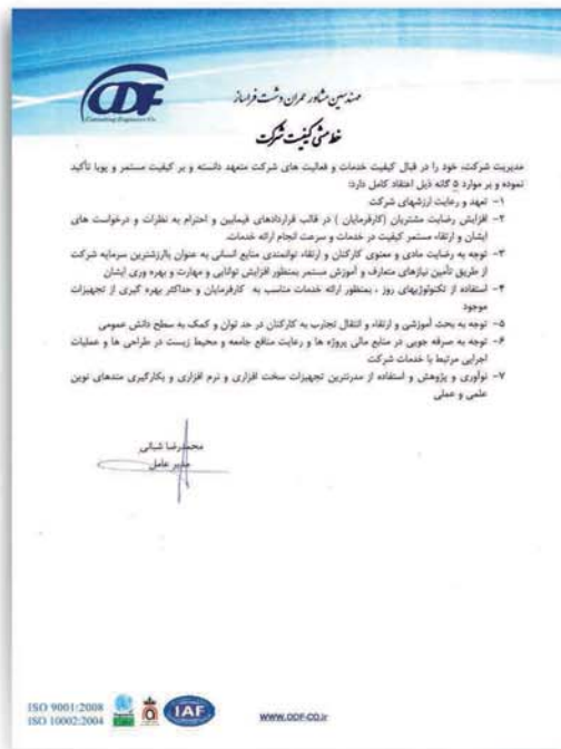
خط مشی کیفیت شرکت