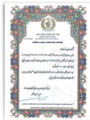
گواهینامه همکاری صنعتی و تحقیقاتی وزارت دفاع و پشتیبانی نیروهای مسلح