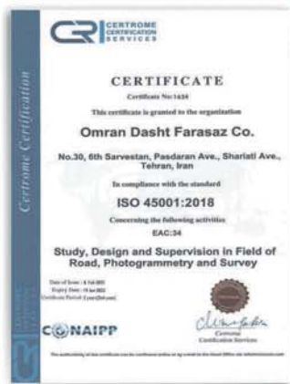
گواهینامه ISO 45001:2018