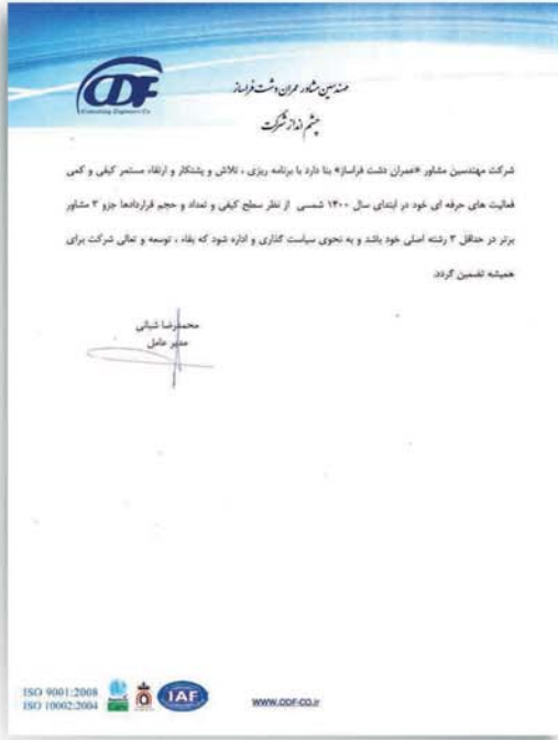
چشم انداز شرکت