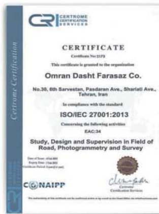
گواهینامه ISO/IEC 27001:2013