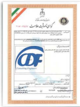
گواهینامه ثبت علامت