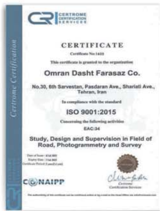
گواهینامه ISO 9001:2015