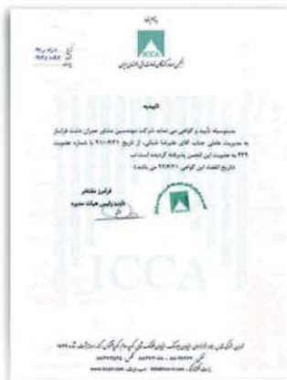
تاییده انجمن صادر کنندگان خدمات فنی و مهندسی ایران