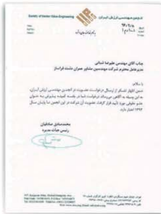
گواهینامه انجمن مهندسی ارزش ایران