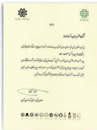
گواهینامه معاونت فنی و عمرانی شهرداری تهران