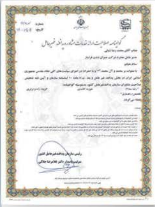
گواهینامه صلاحیت ارائه خدمات مشاوره پدافند غیرعامل