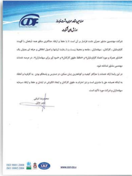
ارزش های شرکت