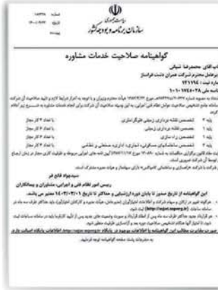
مشخصات گواهینامه صلاحیت خدمات مشاوره