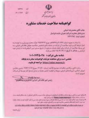
گواهینامه صلاحیت خدمات مشاوره