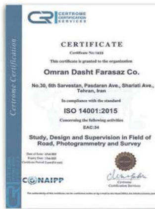
گواهینامه ISO 14001:2015